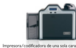
Impresora/codificadora de una sola cara

Las tarjetas de alta definición brindan la mejor calidad de imagen con la más alta funcionalidad. La película HDP se fusiona con la superficie de las tarjetas inteligentes y de proximidad, ajustándose a los relieves que se forman en las tarjetas con chip incrustado.