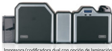
Impresora/codificadora dual con opción de laminación

El diseño modular crece junto con sus necesidades. ¿No está seguro lo que requerirán sus aplicaciones de tarjetas de identificación en el futuro? Esto no es un problema. El modelo HDP5000 se actualiza fácilmente para adaptarse a sus necesidades. Empiece por una unidad básica de una sola cara. Instale los módulos de codificación. Actualice a una impresión dual. Agregue laminación sencilla o una laminación dual simultánea para lograr lo más moderno en cuanto a seguridad y durabilidad de las tarjetas.